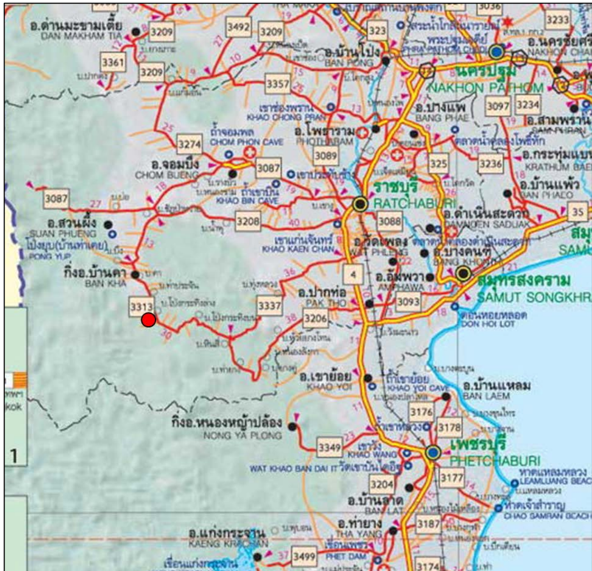
รูปที่ 1-3 แสดงเส้นทางคมนาคมเข้าสู่พื้นที่โครงการ