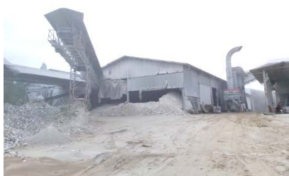
พื้นที่โรงแต่งแร่ของโครงการ