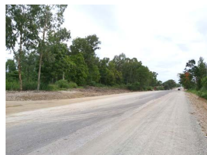
ทางหลวงหมายเลข 3313