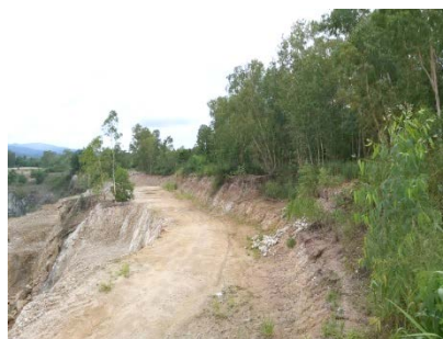
แนวเวนพื้นที่ทำเหมือง