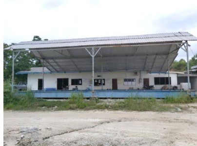
อาคารสำนักงาน